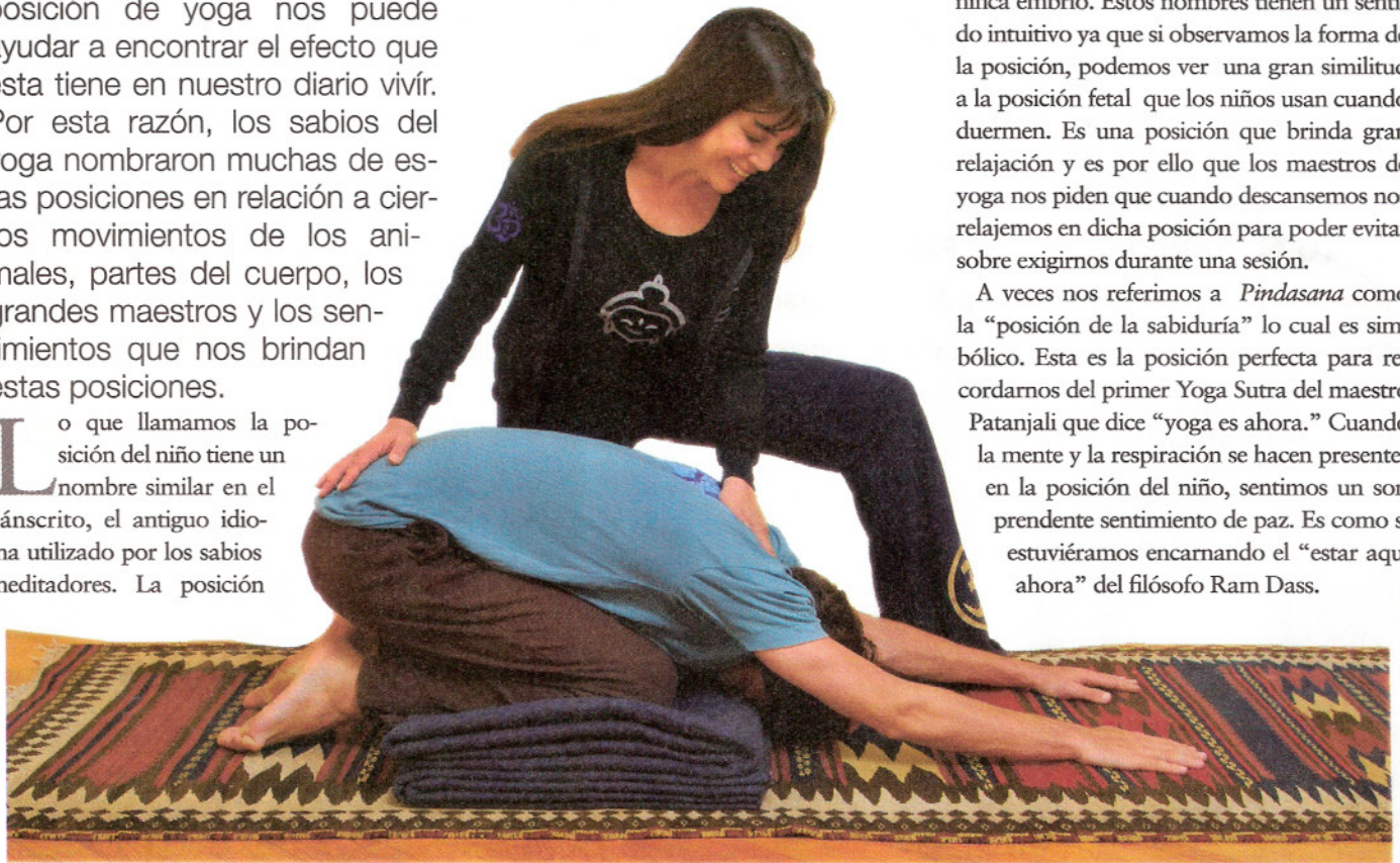
All clothing by Delilah's Energy Center Life Clothing Line. Delilahsenergycenter.com.

A veces nos referimos a Pindasana como la "posición de la sabiduría" lo cual es simbólico. Esta es la posición perfecta para recordarnos del primer Yoga Sutra del maestro Patanjali que dice "yoga es ahora." Cuando la mente y la respiración se hacen presentes en la posición del niño, sentimos un sorprendente sentimiento de paz. Es como si estuviéramos encarnando el "estar aquí ahora" del filósofo Ram Dass.